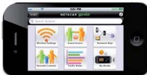
iPhone non inclus.