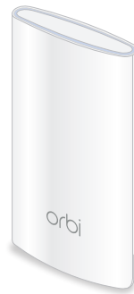
Orbi Satellite (Steckdosendesign) (Modell RBW30)