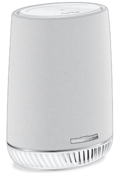
Orbi Voice サテライト