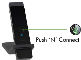
Push 'N' Connect